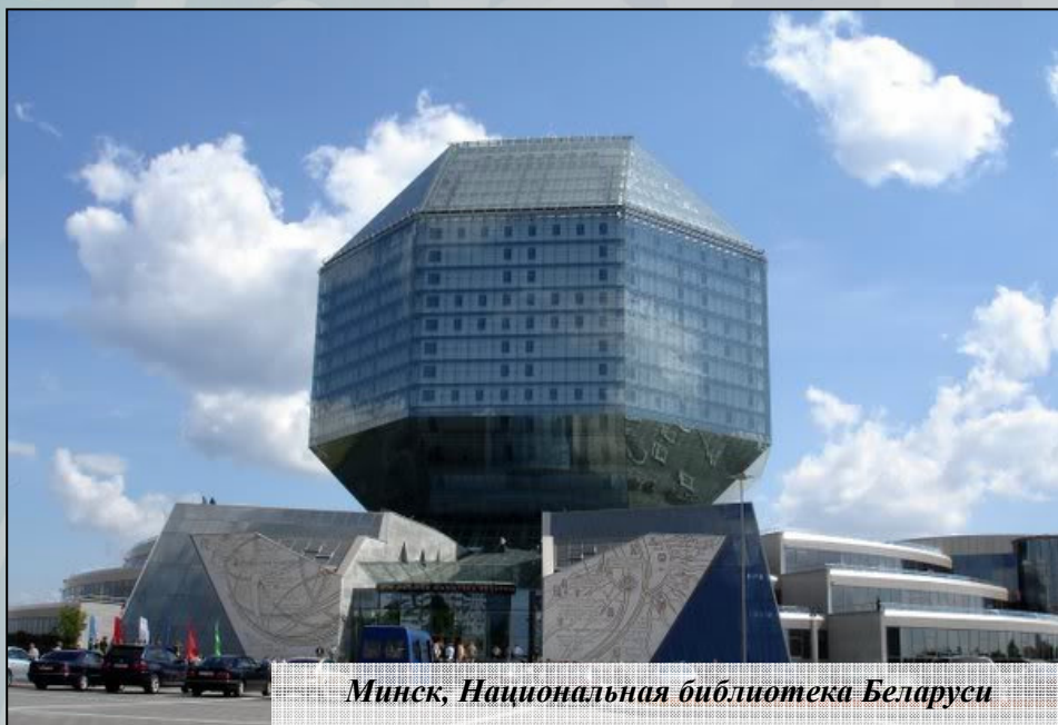
Минск, Национальная библиотека Беларуси

Одним из наиболее интересных сооружений начала XX века является костел Святых Симеона и