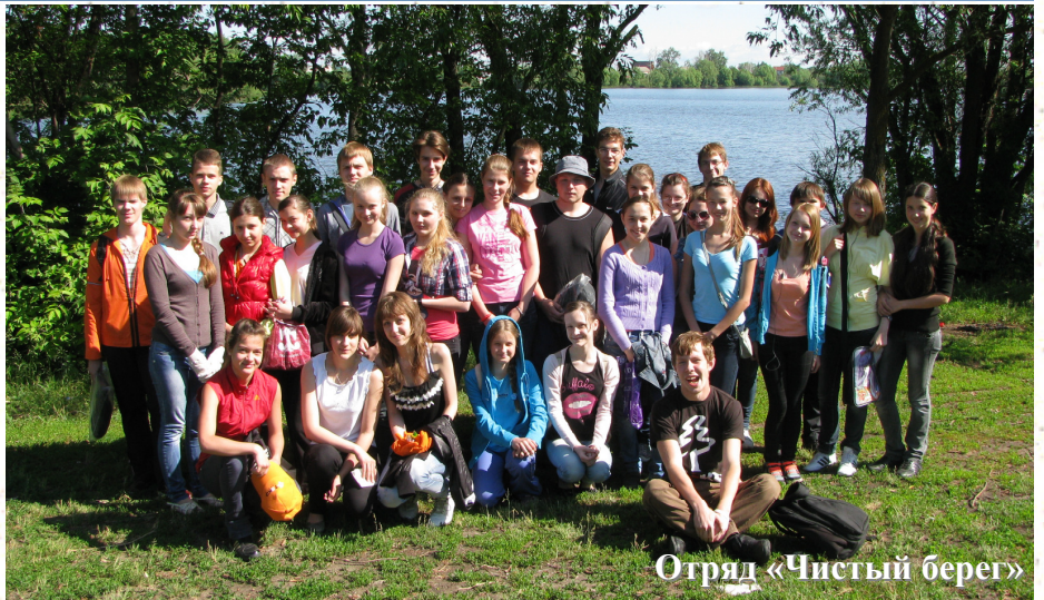
Отряд «Чистый берег»

Что же мы можем сказать о животных? В наше время каждый год на планете бесследно исчезает один животный вид и