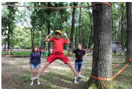
«Косая сажень ... в ногах»