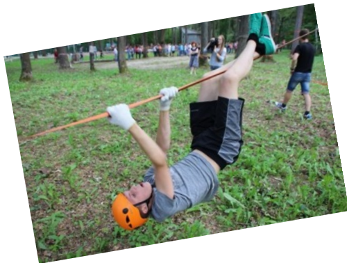
«Рядом с нами вверх ногами...»