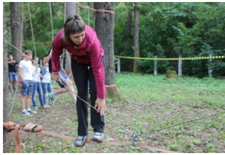
«Мы верим твердо в героев спорта...»