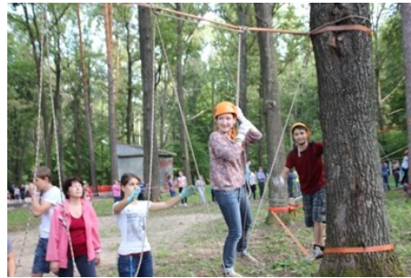
«Мы воспитатели-высотники и с высоты вам шлем привет...»