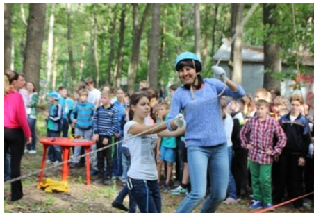
«Нам нет преград ни в море, ни на суше...»