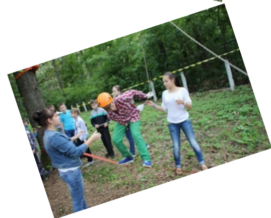
«И знают все ребята, что рядом их вожатый...»