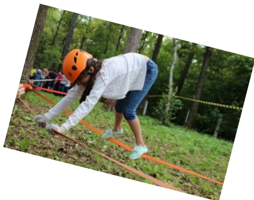
«В целом мире лишь одна я, вот такая заводная...»