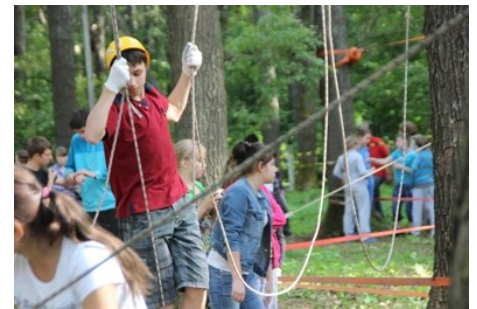
«Сколько веревочка ни вьется, но мне в руки попадется...»