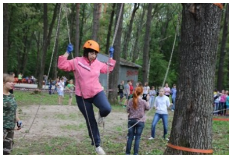
«Нам не страшны ни льды, ни облака...»