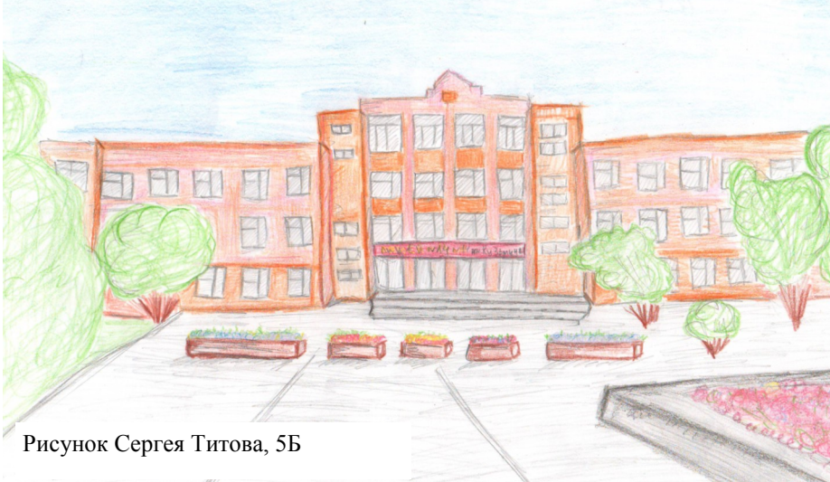
Рисунок Сергея Титова, 5Б

«Я полюбила лицей за то, что он напомнил мне Хогвартс, и здесь я себя чувствую Гарри Поттером!» - так написала Алиса Шаламкова, ученица 5 класса Б, о своих первых впечатлениях от лицея.