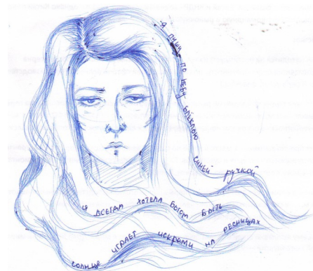
Рисунок Анастасии Мошкиной, 9Б

На ледяной, серой с зимы планете, Здесь, за стеклом, он вдруг найдѐт меня.