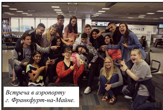
Встреча в аэропорту г. Франкфурт-на-Майне.

Впереди нас ожидало проживание в американской семье. Именно в этот период мне удалось по-настоящему узнать характер американцев, их привычки, приоритеты в жизни.