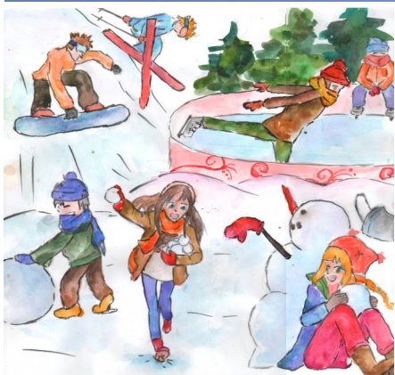
Рисунок Анастасии Ионовой, 8Ж

Интересно узнать, в какие игры можно поиграть зимой, кроме снежков и лепки снеговика? Я знаю очень много игр, в которые можно поиграть, но расскажу про две из них.