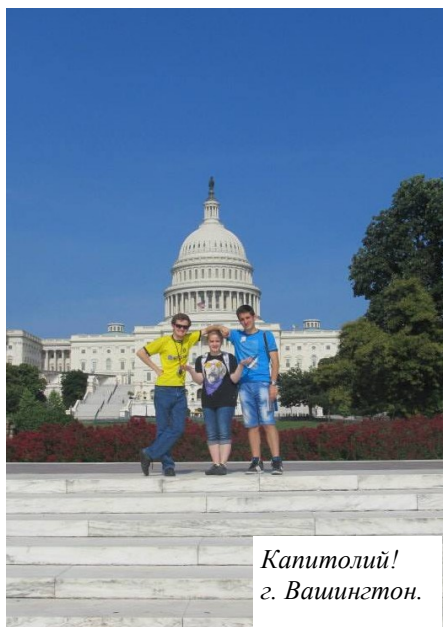
Капитолий! г. Вашингтон.

Особенное место в воспоминаниях занимает Капитолий. Это одно из самых величественных строений в Вашингтоне, сфотографироваться возле которого довольно проблематично, ведь к нему стекаются туристы не только из разных уголков Америки, но и со всего мира. Но для русских туристов нет ничего невозможного — и вот я в кадре!