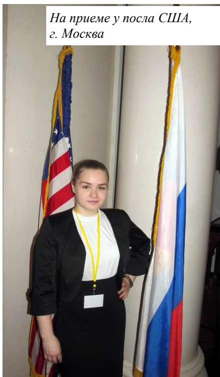
На приеме у посла США, г. Москва