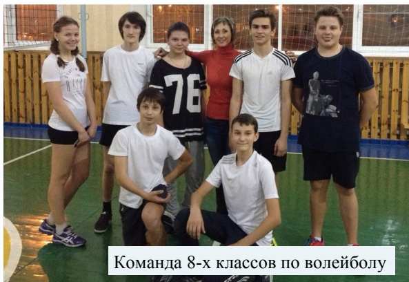
Команда 8-х классов по волейболу

«Мы верим твёрдо в героев спорта, Нам победа, как воздух, нужна» – строчка из этой песни могла бы стать девизом спортсменов нашего лица, которые так рьяно бросились принимать участие во всевозможных городских спортивных мероприятиях. Вдохновленные победами российских спортсменов на минувшей олимпиаде, наши лицеисты этом учебном году покорили не одну спортивную вершину. Так что нормы ГТО нас ни капельки не пугают, а наоборот, побуждают стремиться к гармонии тела и духа. Именно поэтому в этом номере мы открываем рубрику, которая будет освещать участие лицеистов в различных спортивных соревнованиях.