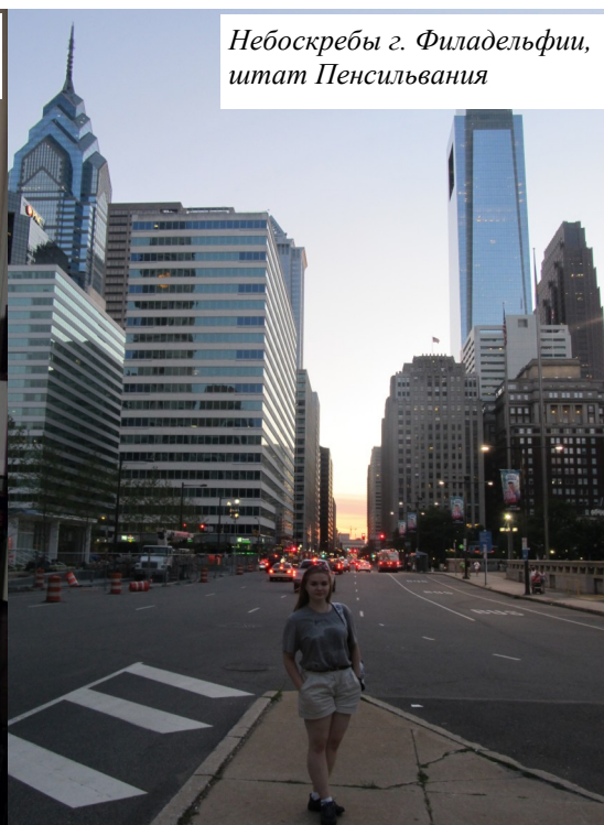
Небоскребы г. Филадельфии, штат Пенсильвания