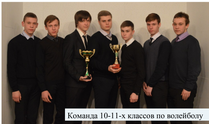
Команда 10-11-х классов по волейболу

Зимой в Тамбове состоялись соревнования по пионерболу и волейболу «Президентские игры», участниками которых стали ученики 7-х и 8-х классов разных школ города. Игра проходила на районном и городском этапах. Блестящую победу одержали команды нашего лица и в пионерболе, и в волейболе, за что им огромное спасибо!