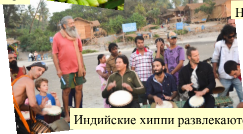
Индийские хиппи развлекаются