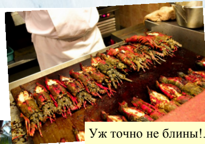
Уж точно не блины!..