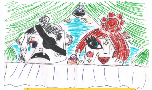
Рисунок Ксений Русиной, 5Г 16

В этом номере мы продолжаем публиковать творения юных журналистов, вышедшие из-под пера в режиме онлайн на занятиях в нашей «Студии журналистики». На сей раз ребята попытались сочинить рассказ на тему «Разговор двух кастрюль», посмотрев на те или иные вещи с разных жизненных позиций.