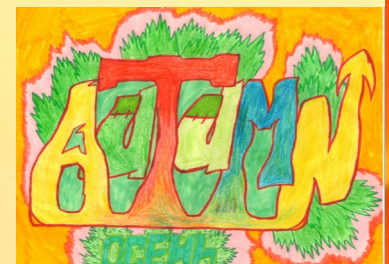
Рисунок Александра Балакишина, 6Г