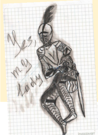
Рисунок Екатерины Федотовой, 6Б