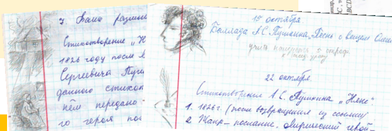
Рисунки Елены Туровской, 6Б