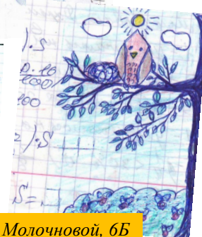
Рисунок Дарьи Молочновой, 6Б