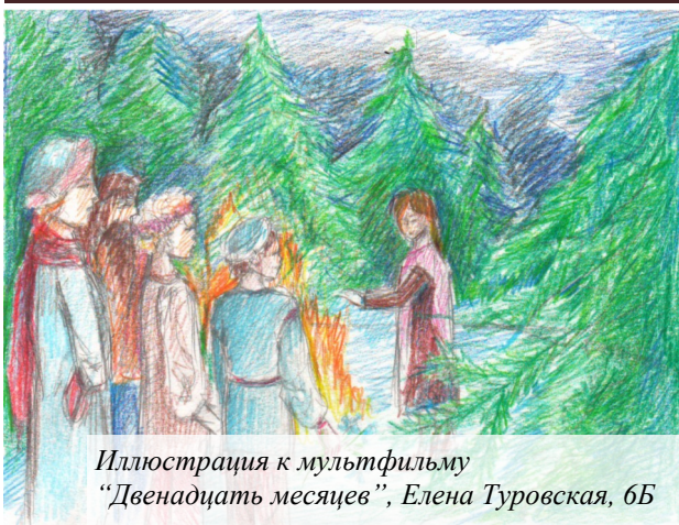
Иллюстрация к мультфильму «Двенадцать месяцев», Елена Туровская, 6Б