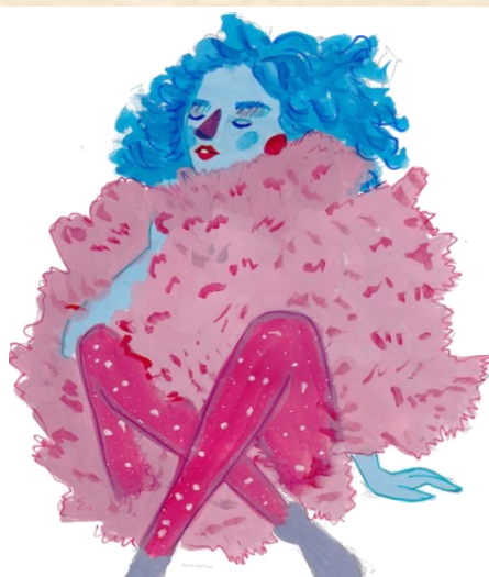
Галя, московская девушка Жени