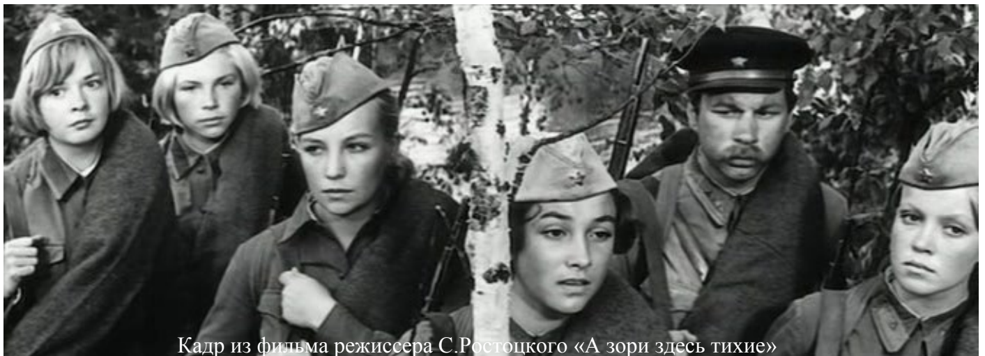
Кадр из фильма режиссера С.Ростоцкого «А зори здесь тихие»