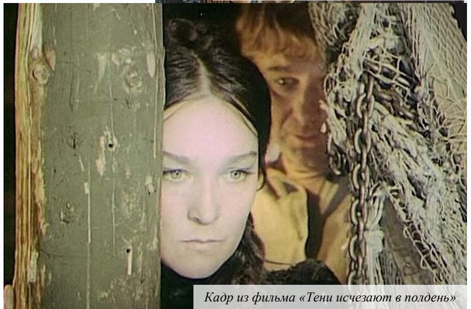
Кадр из фильма «Тени исчезают в полдень»