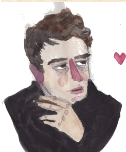
Женя, покоривший сердце Нади