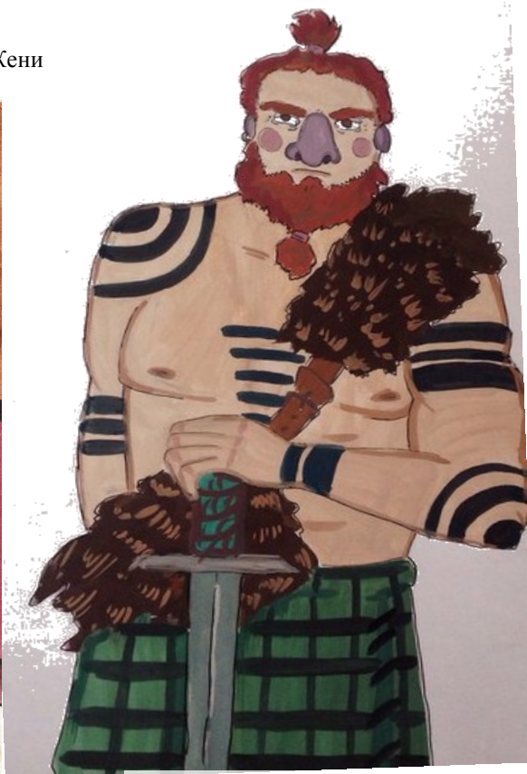
Ипполит, версия 2.0