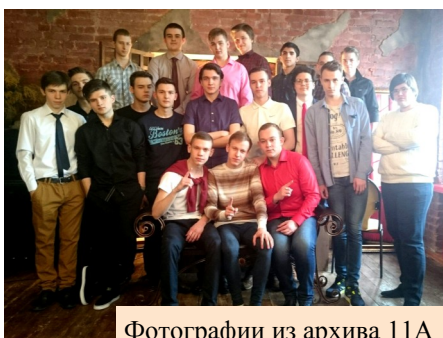
Фотографии из архива 11А

Когда мы были детьми, нам часто приходилось слышать от взрослых, что школа — это наш второй дом, а учителя — наши вторые родители. Тогда, в детстве мы удивлялись, как это возможно, считали эти слова громкими, не имеющими ничего общего с реальностью. Сегодня мы, выпускники, стоящие на пороге чего-то нового и пока неизведанного. И именно сейчас