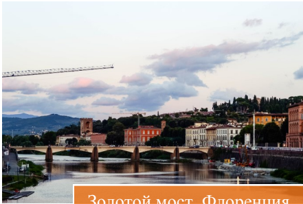
Золотой мост, Флоренция

Италия – очень аппетитная страна. Она пахнет кусочками зажаренного карбоната, свежими листьями базилика и сухим выдержанным красным вином. С каждым годом преодолевая все больше километров, мы с семьей путешествуем по старинным городкам Италии и заглядываем в самые потаенные улочки