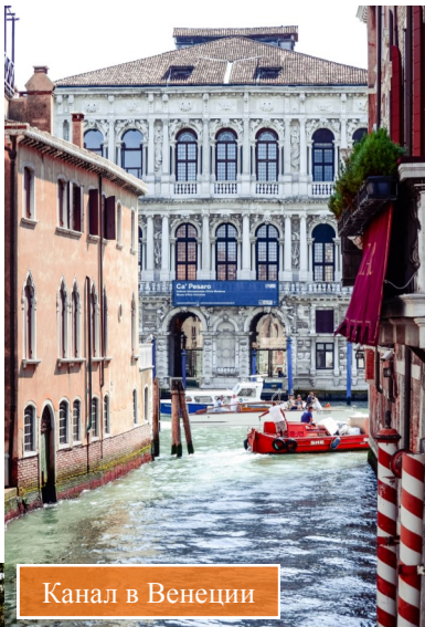
Канал в Венеции

В этом году самой запоминающейся стала поездка в Венецию – удивительный город «на воде». Венеция состоит из нескольких островов, добраться до которых можно на «автобусе» – общественном кате-