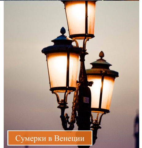
Сумерки в Венеции

настоящий карнавал. Тысячи туристов, утомленные дневной ходьбой, обретают второе дыхание, и в самых лучших платьях и украшениях отправляются на главную площадь Сан Марко, где до полуночи будут литься бархатные звуки скрипки, рояля и виолончели.