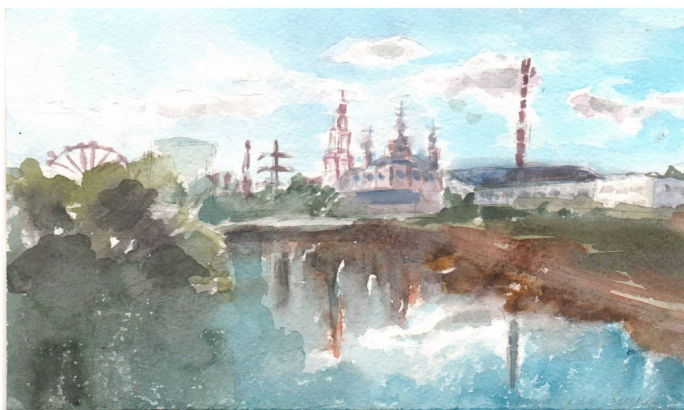
«Набережная Тамбова», Елена Туровская, 7К