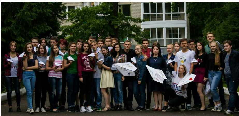
XIII летняя смена в «Энергетике», 2017

Буквально через четыре дня после закрытия XIII летней школы я уже была во Всероссийском детском центре «Смена» на берегу Черного моря. Мое обучение проходило по программе JuniorSkills в направлении «Мультимедийная журналистика». За три недели я написала полноценную информа-