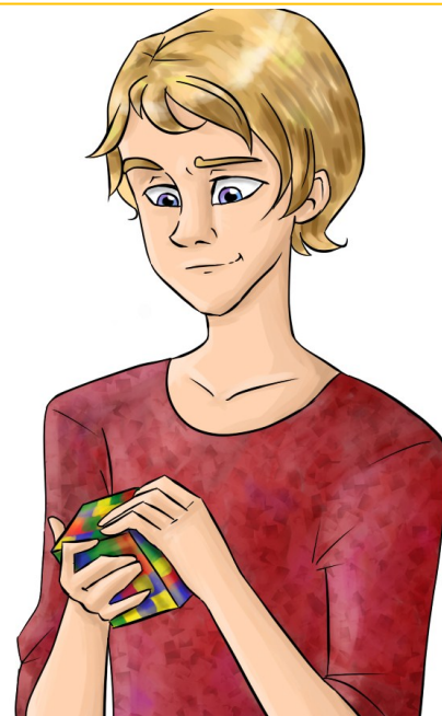
Рисунок Анны Головановой, 8В

"Тамбовских спидкуберов среди призеров, к сожалению, нет. Уро-