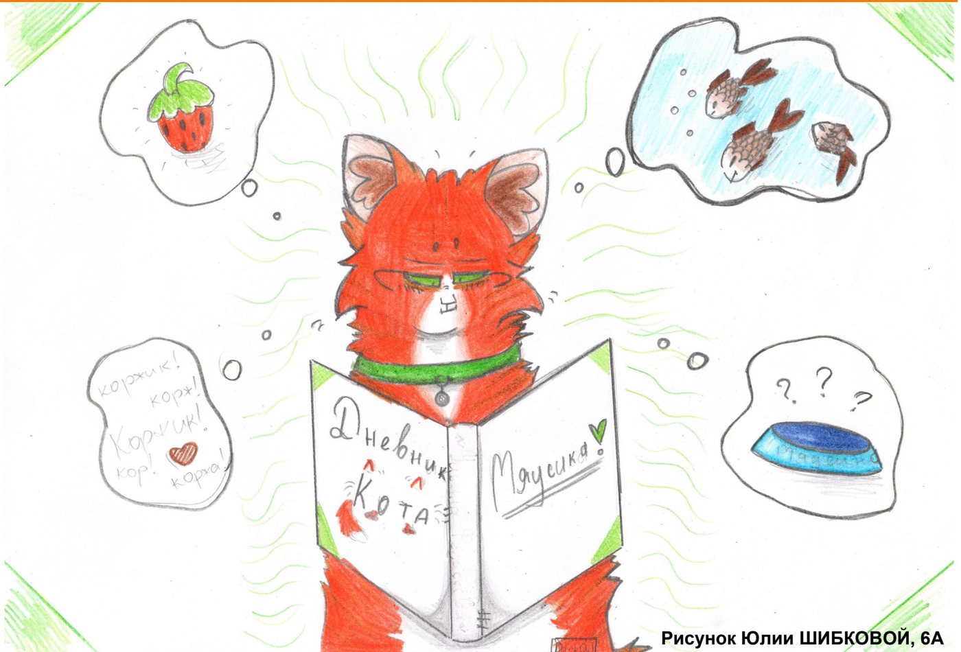
Рисунок Юлии ШИБКОВОЙ, 6А

В сем мяу! Меня зовут Мяусик! С этого дня я веду дневник! И сразу запомните: я самый пушистый в мире, и вообще я первый во всем!*