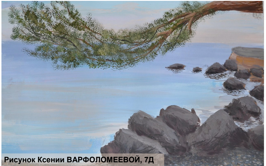
Рисунок Ксении ВАРФОЛОМЕЕВОЙ, 7Д