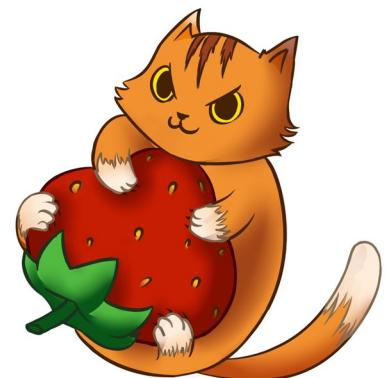
Рисунок С.А. ДУЗЬКРЯТЧЕНКО

Ульяна ФЕДОСЕВА, 6В и Валерия ИВАНОВА, 6В