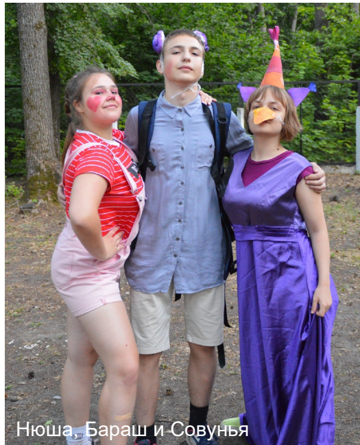
Нюша, Бараш и Совунья