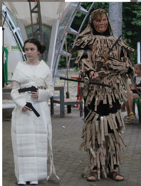
Принцесса Лея и Чубака