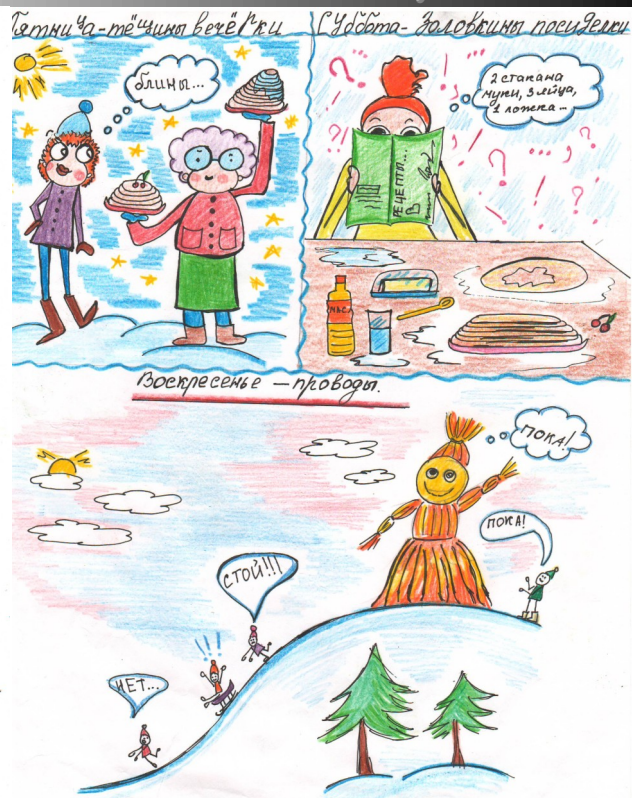
Иллюстрации Евгении Графской, 10В