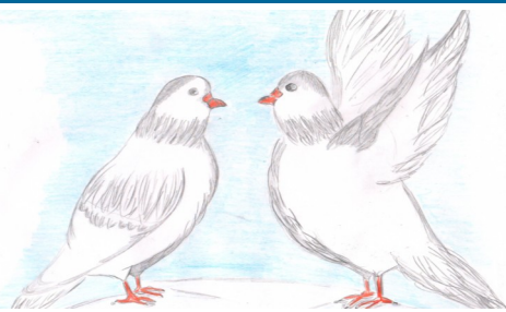
Иллюстрации Евгении Графской, 10В

В один чудесный зимний денек я отправилась на прогулку. Был выходной день, уроки были сделаны, и поэтому у меня было хорошее настроение. Светило солнышко, морозец пощипывал нос, снег блестел на солнце. Я отправилась к подруге в соседний двор. Мы прогуляли с ней часа два и заметили, что мороз начал